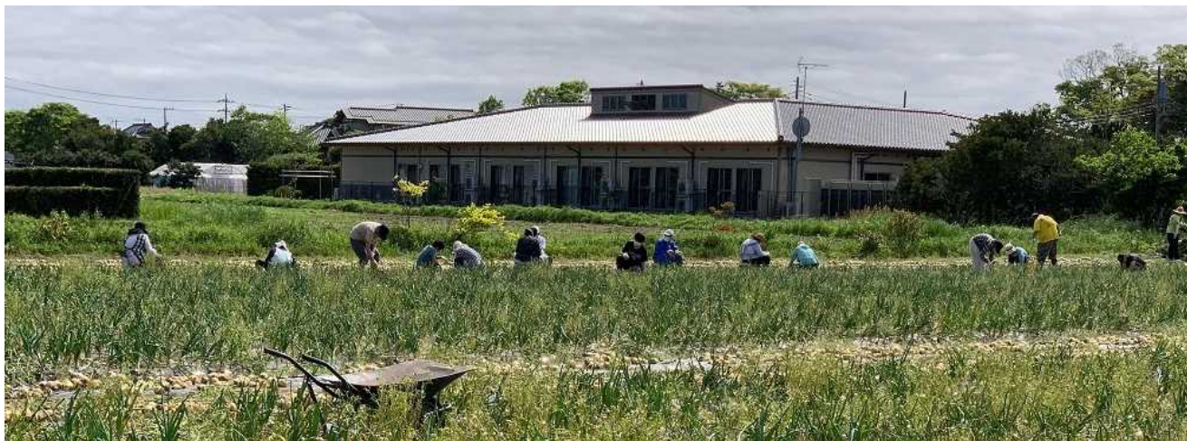
2020年5月 福祉サービス事業所による白子たまねぎ収穫作業風景

農業と福祉の連携「農福連携」の一環として、障害福祉サービス事業所等が農家・農業法人に出向いて作業を行う取り組みがあります。これは「農業」の人手不足と「障害者」の仕事確保の両方の課題解決につなげていく取り組みと言えます。ただ、障害福祉サービス事業所の職員で農業に詳しいものは少なく、一方の農家・農業法人も障害者が行う農作業についての情報が不足しているなど現場で戸惑う場面が多くみられます。